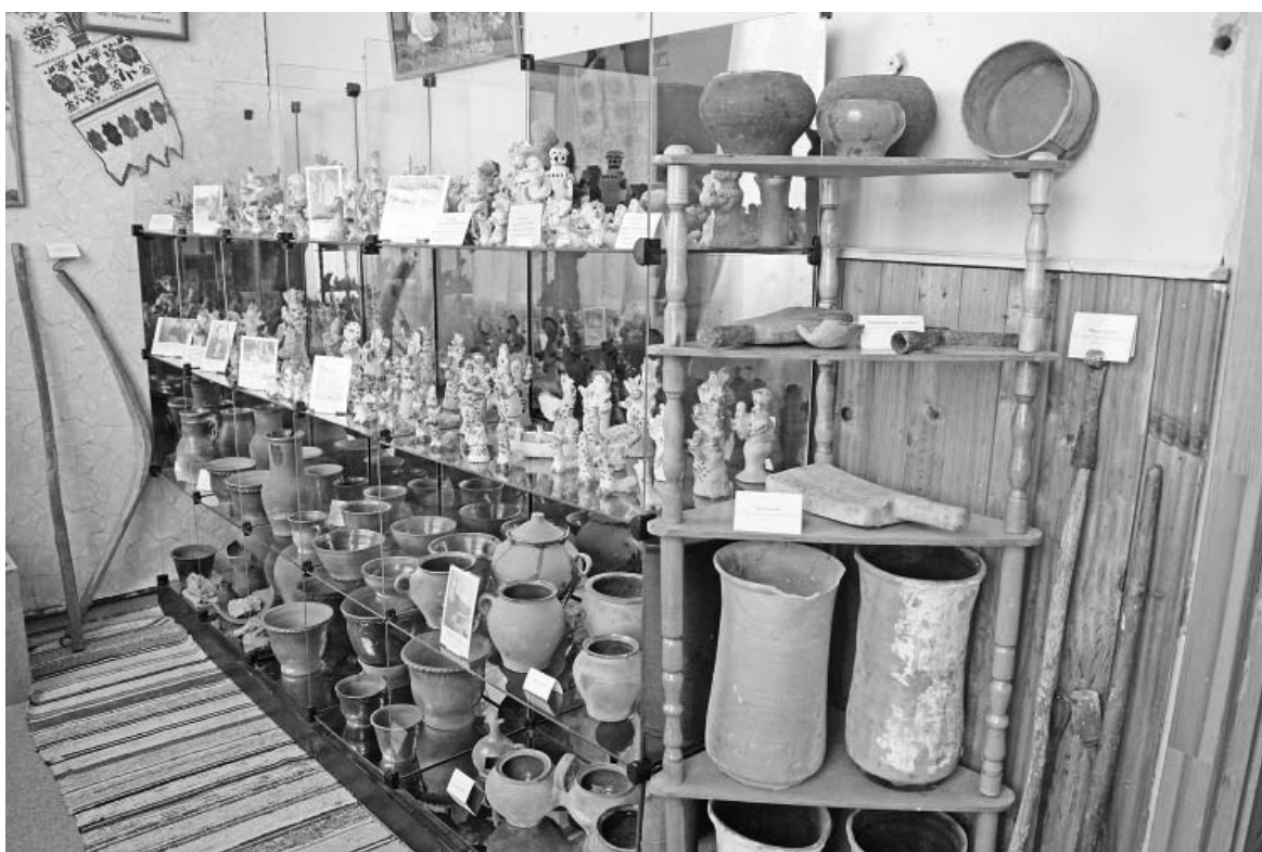
Комната Хлудневского промысла в Думиничской районной библиотеке.

Игрушки также имели спрос у скупщиков ветоши, которые в то время регулярно объезжали все деревни. Они тоже немало способствовали распространению хлудневских свистков и грематух. Ведь выбор детских игрушек тогда был невелик: или деревянные, или глиняные. Никаких тряпичных кукол тогда не делали из-за дороговизны тканей.